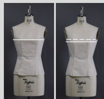
(a)バスト位置に合わせた上衣 (b)良い見映えと評価された上衣 上衣外観におけるバスト位置の影響